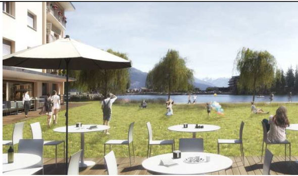
LE PROJET DE RENATURATION